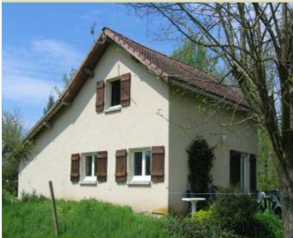
La Poussinière Ile des Escouanes 46130 PRUDHOMAT